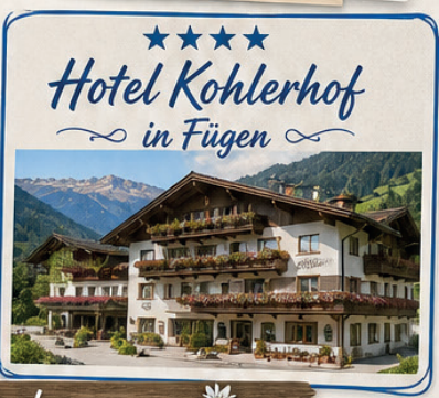
★★★★ Hotel Kohlerhof in Fügen

Heimreise über den Achensee – Achenpass an den Tegernsee , Aufenthalt. Weiterfahrt über Traunstein – Waging am See – Passau , oder Rückfahrt nach Absprache.