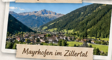
Mayrhofen im Zillertal