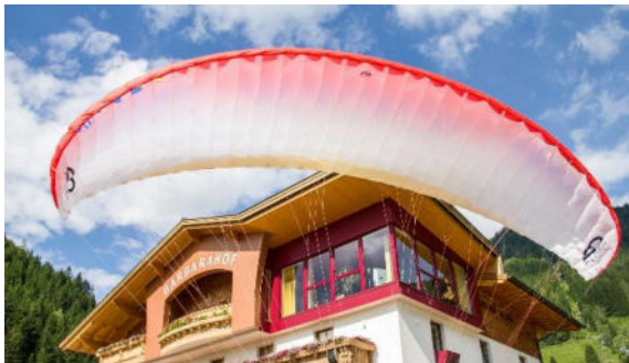
Unterkunft „Barbarahof“