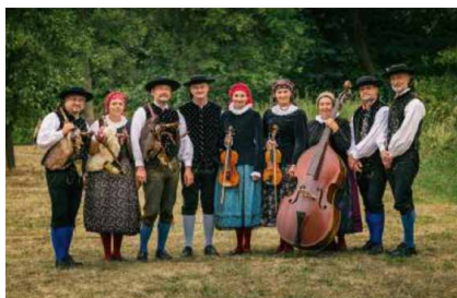
Pošumavská Dudácká Muzika / CZ