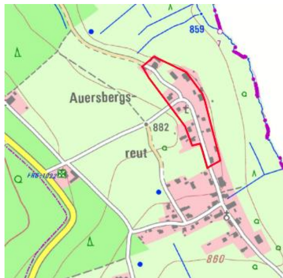
Planausschnitte ohne Maßstab

Der Entwurf zur „Außenbereichssatzung Auersbergsreut-Nord“ liegt zusammen mit der Begründung und den umweltbezogenen Informationen im Rathaus der Gemeinde Haidmühle, Dreissesselstraße 12, 94145 Haidmühle, Zimmer Nr. 3